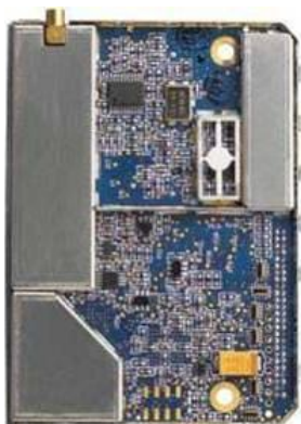
Вид сверху со снятой крышкой