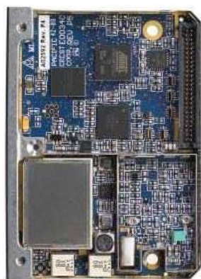
Вид снизу со снятой крышкой